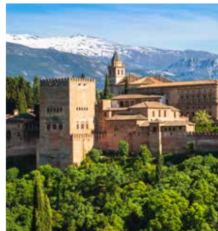
Het beroemde Alhambra in de Spaanse stad Granada, met de Sierra Nevada op de achtergrond

De Elzas staat natuurlijk bekend om haar wijnroutes met proeverijen. Maar ook schilderachtig mooie Middeleeuwse dorpen als Kaysersberg, Riquewihir en Beblenheim bereik je binnen een halfuur. Bovendien is men in de Elzas gek op kerst. Vanaf Sainte Catherine op 25 november tot Driekoningen op 6 januari, veranderen de Elzasser dorpen in Anton Pieck-achtige prentenboeken. Met versierde etalages, duizenden lichtjes, fakkeloptochten, klassieke muziek en de geur van peperkoek en kaneel-glüh-wein waant u zich in een levende kerst-kaart. De mooiste kerstmarkten vind je in de stad Colmar. Hier zijn er wel zes, ver-spreid over de verschillende historische wijken van de stad. Naast keramiek, gas-tronomie, kerstversiering en cadeautjes is er zelfs een aparte markt voor kinderen. Toch liever een andere stadse sfeer oppik-ken? Dan kan ook, want vanuit Colmar bereikt u snel de landelijke Duitse stad Freiburg am Breisgau met haar Middel-eeuwse Altstadt, gezellige smalle winkel-straatjes en klassieke uitstraling. Freiburg is daarmee de perfecte tegenhanger van de hypermoderne Zwitserse stad Basel. Ook heel dichtbij, met haar veertig musea en moderne architectuur. Door al die culturele en gastronomische afleidingen is uw wintersportvakantie minder voor-spelbaar dan ooit. En dat smaakt waar-schijnlijk naar meer. [NvE]