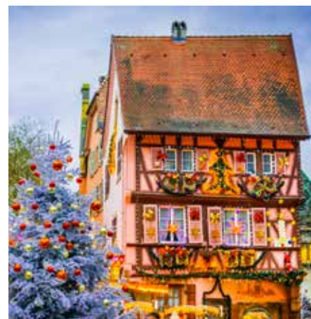
Colmar in de Franse Elzas is in kersttijd een sprookjesstad