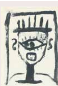
PAUL KLEE: AS A DETERRENT / ZENTRUM PAUL KLEE, BERN.

Lightshow Max 500 27 november t/m 19 januari 2020, Hofburg, Innsbruck.