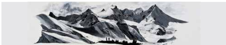
HÔTEL LE MORGANE, CHAMONIX

DESIGNED BY EARTH: foto's van Mischa Crumbach, t/m 30 november in de Kunsträume in Zermatt, Zwitserland * POLARIS FESTIVAL: festival van elektronische muziek, 28 november t/m 1 december in Verbier, Zwitserland * BERGFILMFESTIVAL: CERRO TORRE: documentaire over de beklimming van de gelijknamige berg, 9 en 10 december in Sexten/Sesto, Italië * SYMPHONIEKONZERT FREUNDE door de Münchner Symphoniker, 21 december in Festsaal Werdenfels in Garmisch-Partenkirchen, Duitsland.